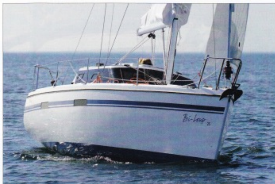
▲ Si la hauteur du franc-bord, le rouf court et la déco restent caractéristiques de la gamme, le dessin de la coque aux lignes plus tendues et sans frégatage témoigne d'une réelle évolution.

et ceinturé de hublots qui offre une vue panoramique sur l'extérieur. Le reste de l'aménagement (cabinet de toilette et cuisine) est simple et pratique. Le coin cuisine peut même contenir un four ou un micro-ondes (en option). On l'aura compris, malgré sa petite taille, l'intérieur du Bi-Loup est idéal pour la croisière. Côté décoration, le 26 est très soigné. Le choix de l'essence de bois et des options est laissé au propriétaire. Le Bi-Loup est un voilier qui se construit à la carte ! Il en va de même pour le stade des finitions. Le client peut choisir d'acheter un bateau prêt