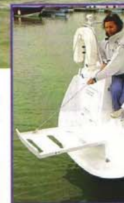
Simple et efficace: l'échelle de bain sert également à fermer le tableau arrière pour sécuriser le cockpit en navigation. Une bonne idée!

L'idée préconçue selon laquelle un « biquille ne fait pas de près » disparaît peu à peu. À force de se creuser les méninges, les architectes ont